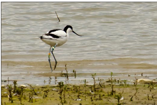
Farberinger Säbelschnäbel am 15.05.2012, Plessenteich NU.