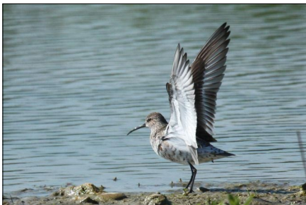
Sichelstrandläufer am 14.05.2012 am Mooswaldsee GZ.