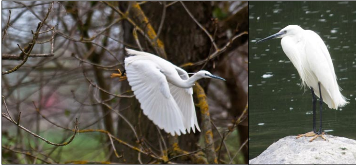
Seidenreiher am 13.04.2012 am Öpfinger Stausee UL und am 06.05.2012 an der Neckarstaustufe Hirschau TÜ.