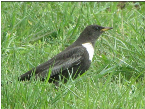
Ringdrossel am 13.04.2012 Untermarchtal UL.