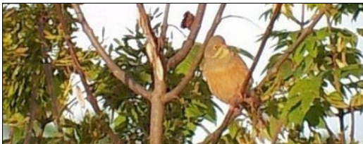
Ortolan am 03.05.2012 auf der Vördere S.