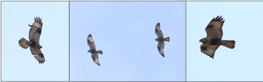
Gleich 7 Raufußbussarde hielten sich am 09.03.2012 am Federsee BC auf.