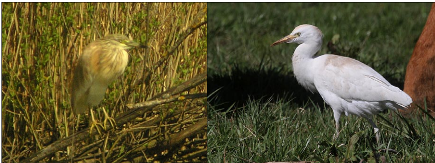
Rallenreier am 01.05.2012, Plessenteich NU und Kuhreier am 10.04.2012 bei Donaueschingen VS.