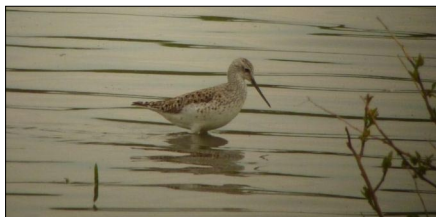
Teichwasserläufer im Prachtkleid in der Wagbachniederung KA/HD am 11. April 2012.

1 Ramminger Moos UL (J.Fendt, K.Schilhansl, K.Anka), 1 am 13.u.19.4.12 Plessenteich NU (K.Schilhansl, T.Epple, W.Gaus), 5 am 14.4.12 Schurrsee DLG (W.Beissmann), je 1 am 15.4.12 und 1.5.12 sowie 2 am 22.4.12 Wagbachniederung KA/HD (V.Schmidt, A.Deißner, K.Tümmler, A.Albietz), je 1 am 18.4.12 Winzeln RW (L.Hensle), am 22.4.12 Lippach AA (R.Kübler) und am 24.4.12 Ziplingen AA (S.Gerner), 3 am 24./25.4.12 im Gundelfinger Moos DLG und 1 am 26.4.12 Schmiechener See UL (T.Epple, J.Fendt, C.Moning), 1 am 29.4.12 und 2.5.12 Schurrsee DLG (M.Schmid, H.Bihlmaier, W.Beissmann, T.Epple, H.Kohler u.a.), 4 am 30.4.12 und 1 am 3.5.12 Bucher Stausee AA (P.Wolf, S.Natterer) sowie 1 am 4.5.12 Federsee BC (J.Einstein).