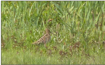
Doppelschnepfe am 15.05.2012 am Schurrsee DLG.