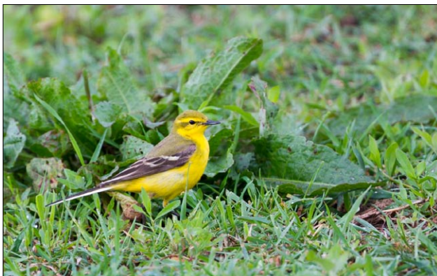
Gelbkopf-Schafstelze am 06.05.2012 am Stuten-see bei Friedrichstal KA.