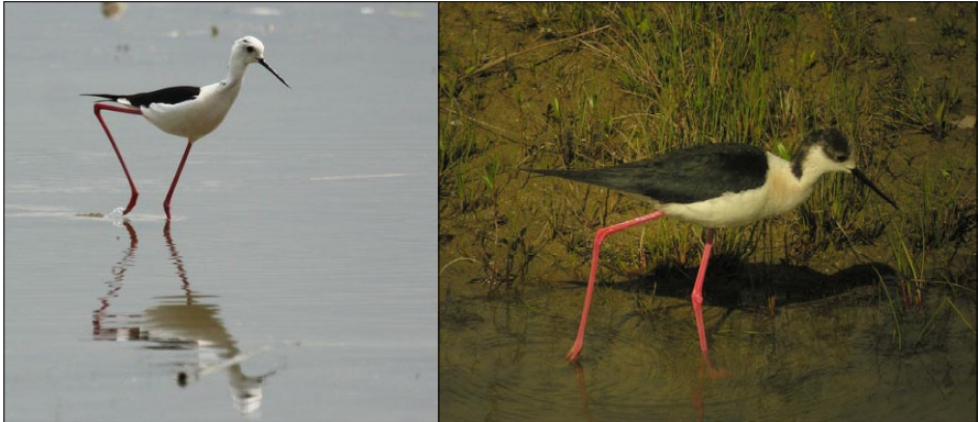
Stelzenläufer am 04.06.2012 am Mooswaldsee GZ und am 13.05.2012 am Plessenteich NU