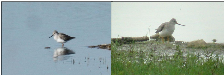
Terekwasserläufer am 13./14.05.2012 am Schurrsee DLG.